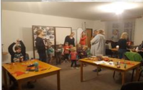
Vánoční dílnička nejen pro děti