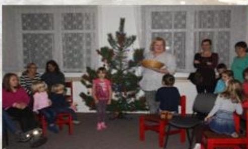
Vánoční nadílka dětem