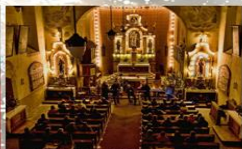
Adventní koncert v kostele